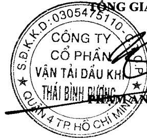
PHÙNG ANH TUẤN